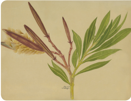
פירות הרדוף ציור של רות קופל

מפתיעה העובדה כי ההרדוף, הנפוץ בטבע במעונות לחים, גדל בתרבות במגוון תנאים ונחשב בגינון לצמח חסכן במים