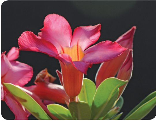
▲ אדניון נפוח, הפרח דומה מאד לפרח ההרדוף.