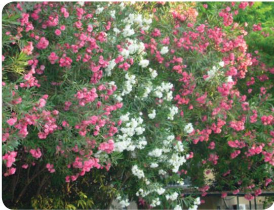
▼ הרדוף הנחלים - שימוש במגוון צבעים.