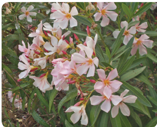
▲ הרדוף נחלים ננסי.